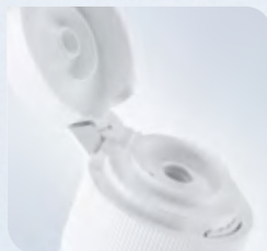
Kein Aufschrauben nötig