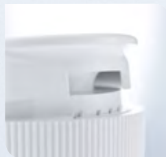
Originalitätssiegel verbleibt im Verschluss