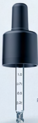
Pipette mit Graduierung